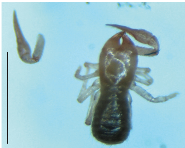
図 1. ニホンカブトツチカニムシ Mundochthonius japonicus Chamberlin, 左上は虫体から分離した触肢. スケールは 1 mm.

本方法は, 少量のサンプルによる DNA 解析を可能とするために, Montero-Pau et al. (2008) および Suyama (2011) の方法を応用した. これらの方法は, 動物プランクトンの