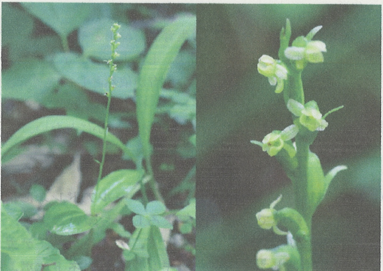
図3. : ミヤケラン. 右：花のアップ