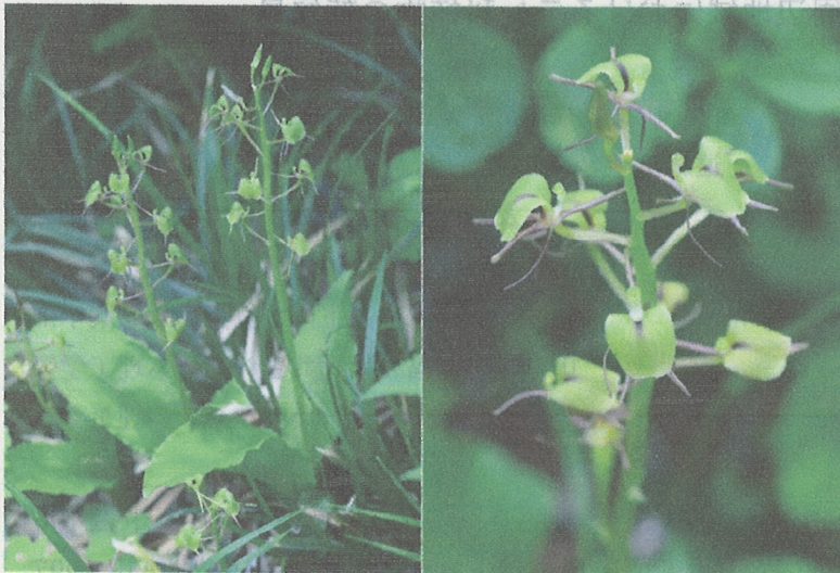
図1. シテンクモキリ. 右：花のアップ