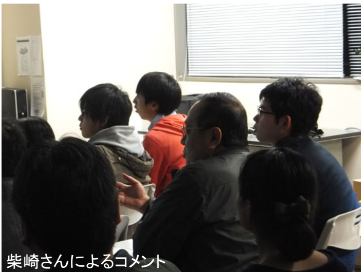
柴崎さんによるコメント